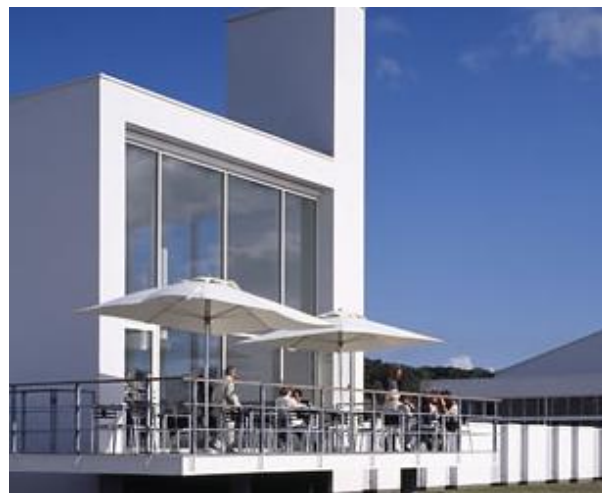
Terrassen ved Glascafeen

champignon flødesovs plus tilbe-hør). De der valgte hvidvin oplevede en særdeles frisk og sprød drik (Fire Comte).