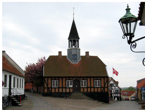
Det Gamle Rådhus i Ebeltoft

Rådhuset blev opført som erstatning for byens første rådhus, der havde ligget på samme sted siden 1576. Men allerede i 1840 var rådhuset for småt til formålet og blev i stedet brugt som vagtlokale for byens vægtere og brandmænd.