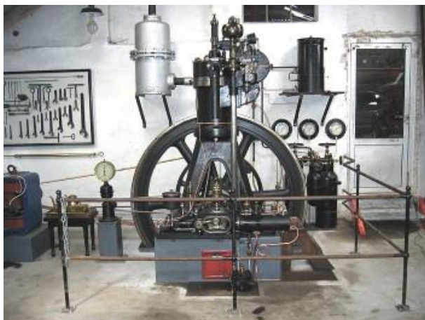
Augsburg Diesel – 1906

Turen gik til "Dansk Motor- og Maskinsamling" lidt udenfor Grenaa. Danmarks største samling af motorer og maskiner fra landbrug, fiskeri og industri. Rigtig mange maskiner står i flot stand og fremvises i kørende stand.