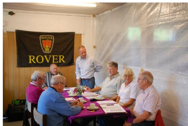
Formanden aflægger beretning