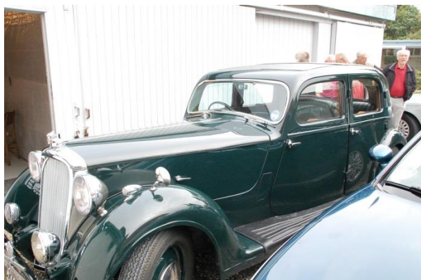
Formandens bil er ankommet

Refereret af redaktøren