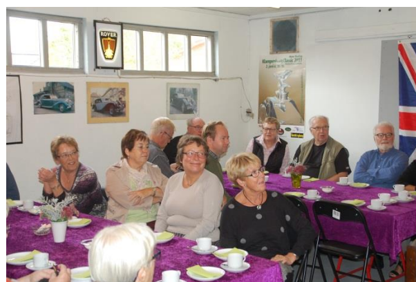
Forsamlingen lytter andægtigt