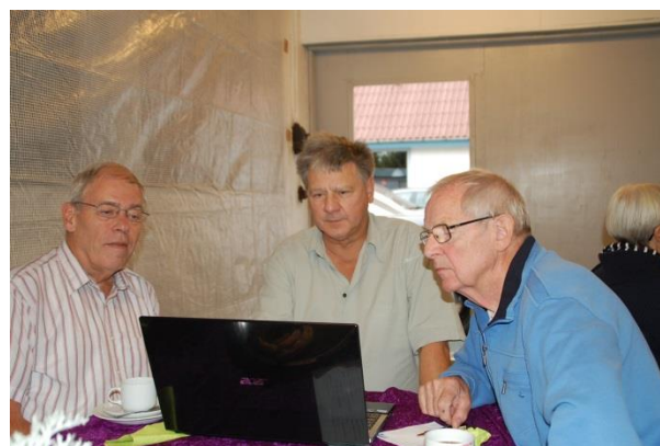
Der studeres annoncer