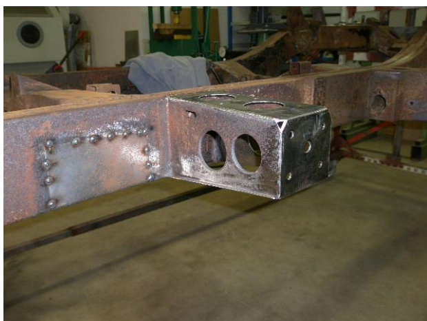
Ny bæream til karrosseriet