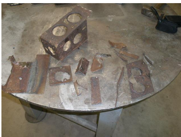
Udskiftede plade dele fra rammen