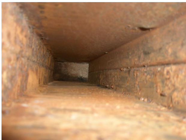
Et kig ind i rammen

Når rammen er færdig renoveret, begynder renoveringen af karrosseriet